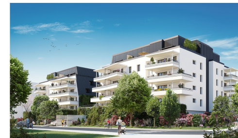
BATIMENT D - MONTEE 5 APPARTEMENT T2 N°5013 au R+1